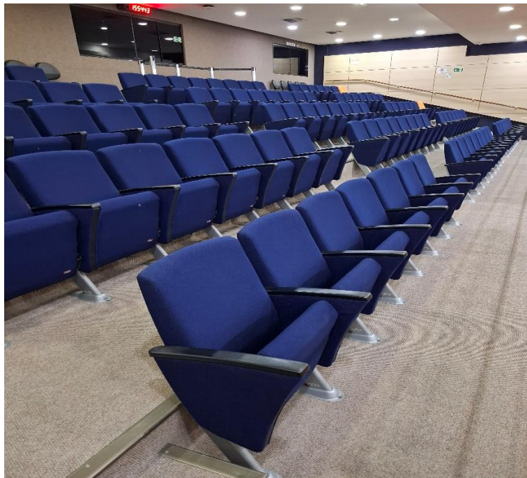
Plenário: local dos carpetes e estofados.