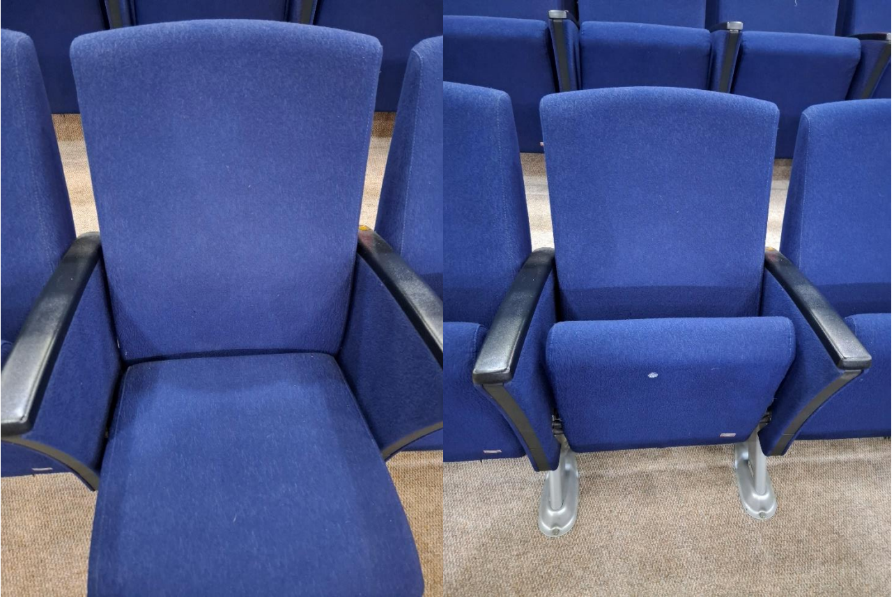
Estofados a serem higienizados (110 assentos).